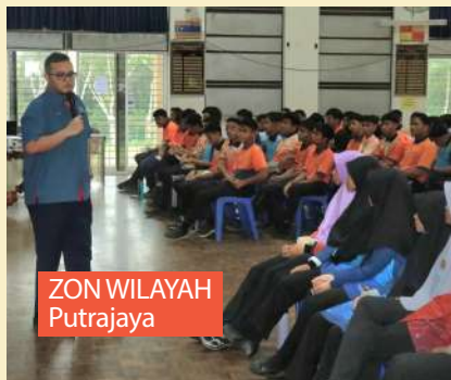
ZON WILAYAH Putrajaya