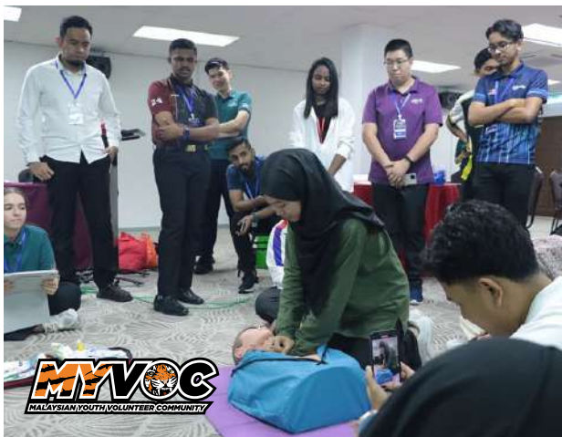
Pembelajaran dan aplikasi kemahiran ini bukan sahaja untuk pengurusan bencana tetapi juga agenda keselamatan dan perpaduan negara