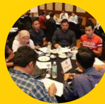
Program Penghakupayaan Program MBM-MBD