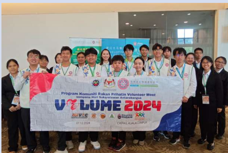
Program Komuniti Rakan Prihatin Volunteer Meet sempena Hari Sukarelawan Antarabangsa

Antara slot yang dikongsikan ialah asas pertolongan cemas, pengendalian radio amatur, simulasi dan tatacara pengurusan bencana, bantuan sokongan OKU dan bantuan psikologi dan Water, Sanitation & Hygiene (WASH).