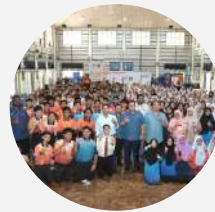
Program Belia Masuk Sekolah Generasi Madani

▶ RM200,000 Dana pelaksanaan. Bermula Januari 2025, Maksimum RM3,000 setiap MBD