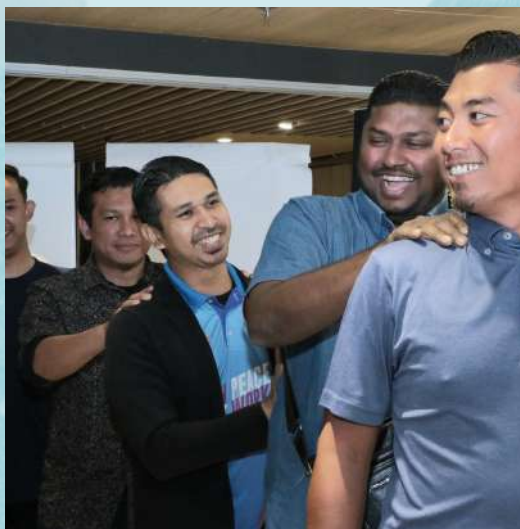
Antara aktiviti dalam kumpulan melibatkan kepimpinan MBM dalam sesi Retreat Exco MBM