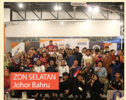
ZON SELATAN Johor Bahru