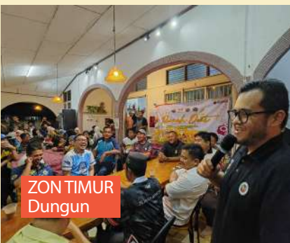
ZON TIMUR Dungun

Penganjurannya merupakan kerjasama daripada MBM, KBS dan rakan strategik Chery Malaysia dan Projek Belia Mahir.