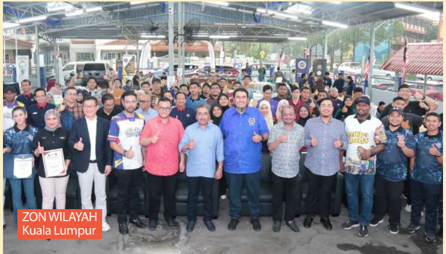
ZON WILAYAH Kuala Lumpur