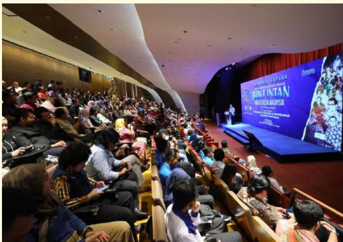
Presiden MBM ketika menyampaikan ucapan di hadapan tetamu yang hadir menyaksikan Tayangan Perdana Dokumentari Jubli Intan MBM di Auditorium Menara AFFIN @TRX. Penggunaan auditorium ini ditaja sepenuhnya oleh pihak Menara AFFIN.