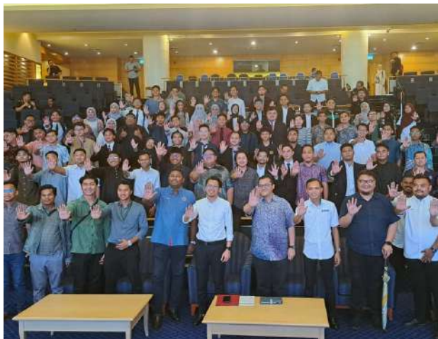
Program ini disertai belia-belia dari pelbagai kelompok antaranya persatuan belia, majlis perwakilan pelajar universiti, institusi perguruan, komuniti e-hailing mahupun individu.