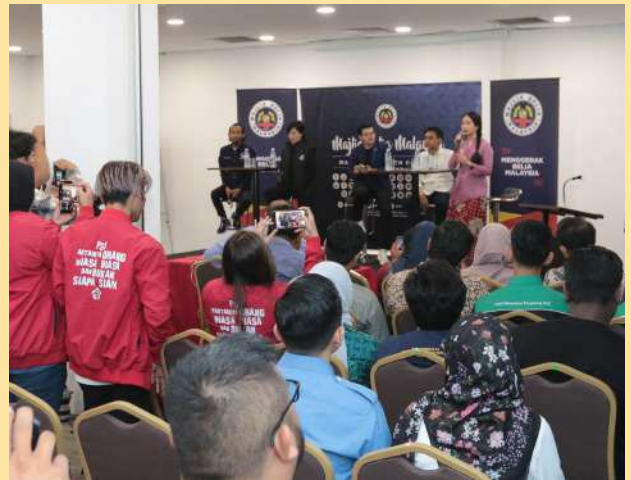
Seramai lebih 100 orang telah hadir menyaksikan sesi bual bicara ini, antaranya penyokong dari parti politik Indonesia, anak muda Malaysia, dan wakil parti politik Malaysia