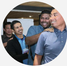
Program Transisi Kepimpinan MBM

Kali terakhir dilaksanakan ialah 'MBM in Business' (2017-2018)