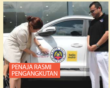
PENAJA RASMI PENGANGKUTAN