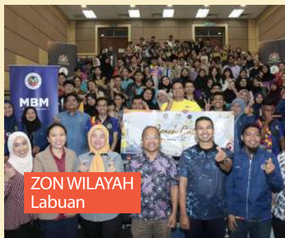
ZON WILAYAH Labuan