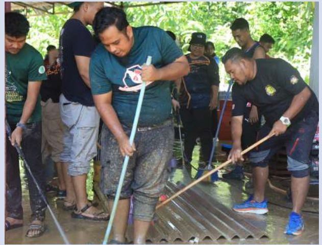
Semoga kehadiran sukarelawan ini mampu meringankan beban penduduk kampung dalam proses mengembalikan kehidupan seperti sedia kala

MBM merakamkan ucapan terima kasih kepada seluruh pimpinan pertubuhan belia, sukarelawan, mahasiswa serta belia-belia yang telah bersama dalam membantu misi bantuan pasca banjir ini.