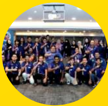
Program Transisi Kepimpinan MBM