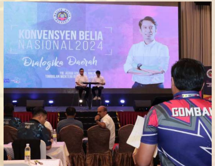
Salah seorang peserta mengemukakan soalan kepada YB Timbalan Menteri Belia dan Sukan dalam program ini.